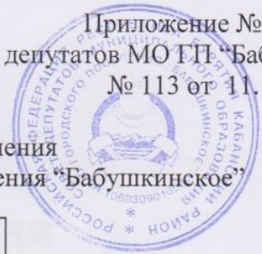
Схема структуры местного самоуправления муниципального образования городского поселения "Бабушкинское"